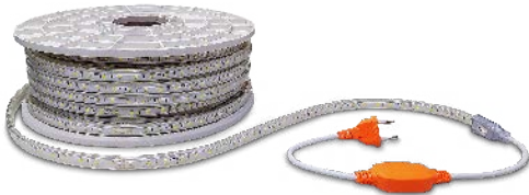
Rectificador 6A 230V no incluido