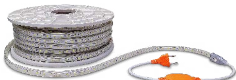
Rectificador 6A 230V no incluido