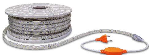
Rectificador 6A 230V no incluido